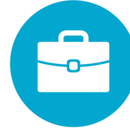
Esnafa Özel Sigorta Paketleri (Otel, İşyeri, Eczane, Akaryakıt, Kobi)