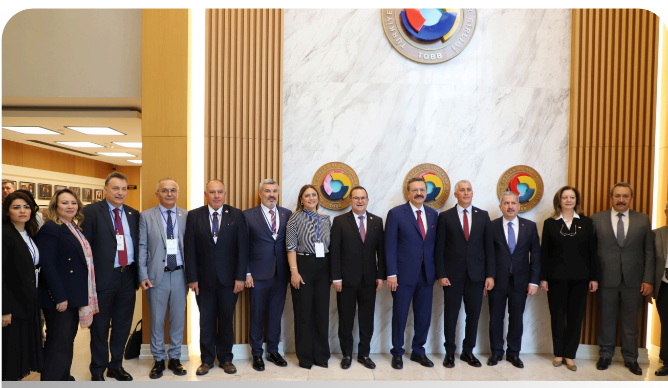
Türkiye - KKTTC 2. Ekonomi Konferansı 2. SAYFA