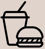
Food & Beverages

Halal Trade, Logistics and Manufacturing Expo will further strengthen Africa's position as a global halal hub and put forward the economic values of Halal for the world.