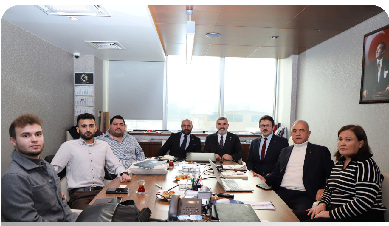
İHRACATTA YENİ UFUKLAR 2. SAYFA