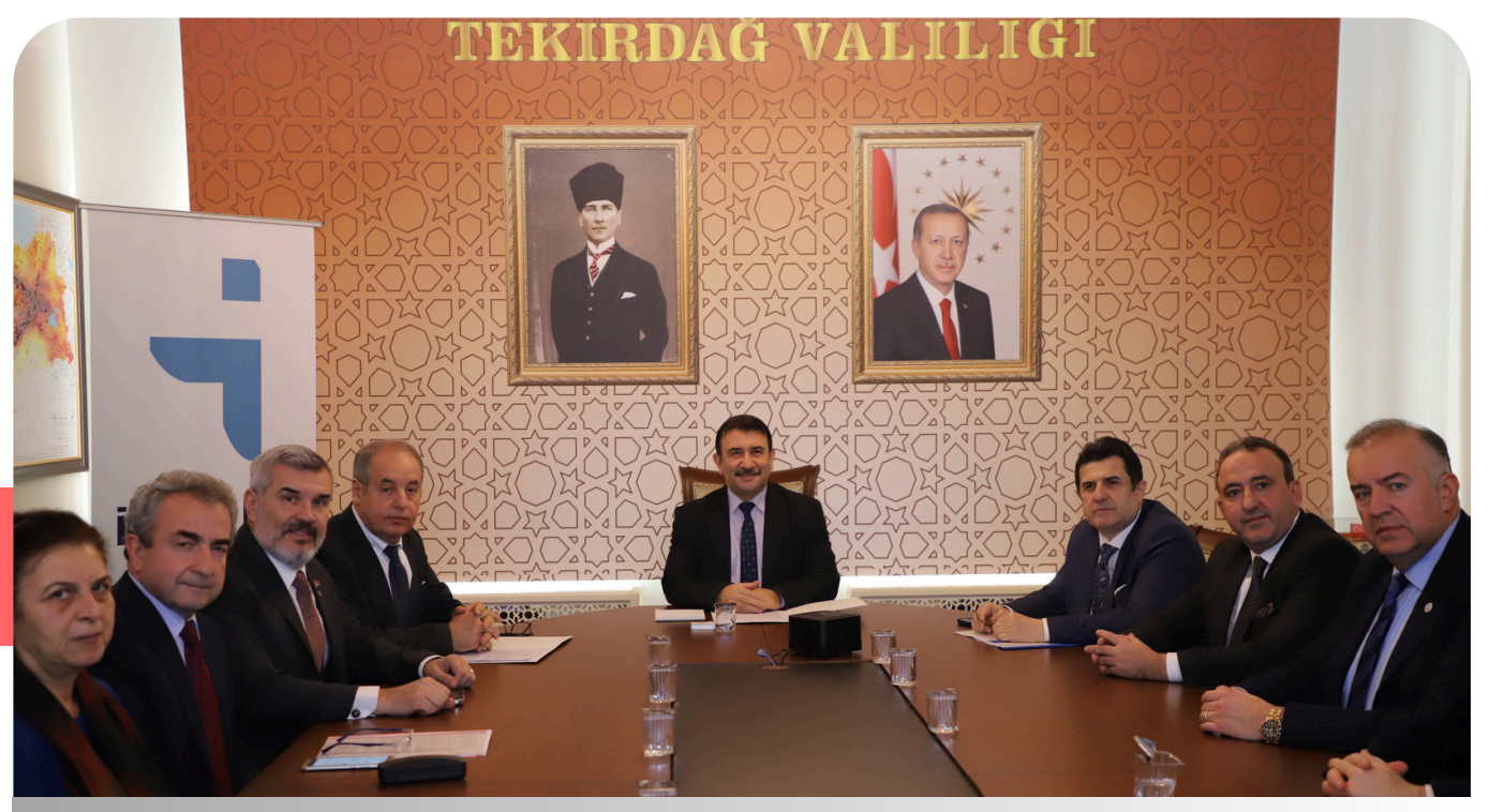
İSTİHDAM VE MESLEKİ EĞİTİM TOPLANTISI 3. SAYFA