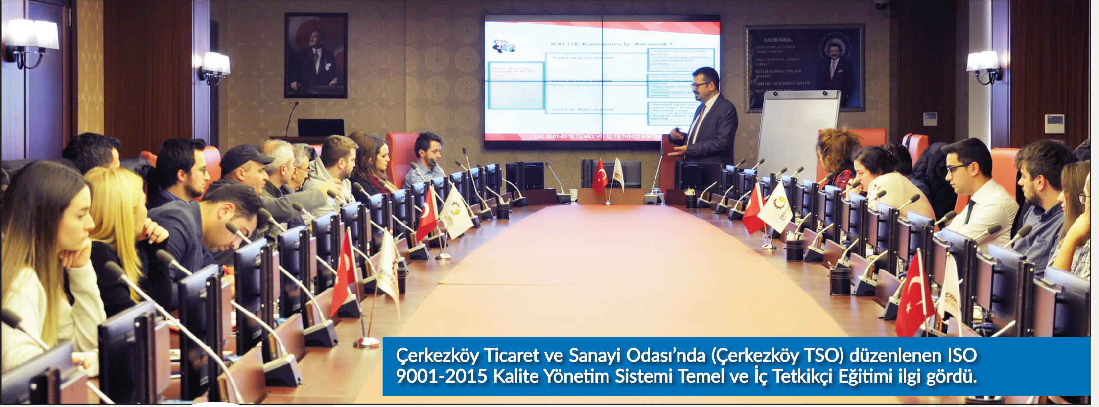
Çerkezköy Ticaret ve Sanayi Odası'nda (Çerkezköy TSO) düzenlenen ISO 9001-2015 Kalite Yönetim Sistemi Temel ve İç Tetkikçi Eğitimi ilgi gördü.